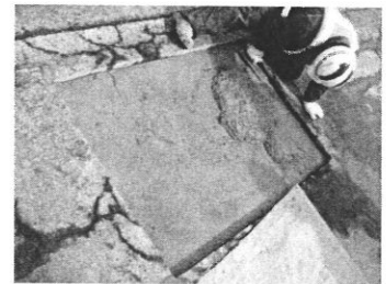
太平洋ゴムラテモルタル

ているコンクリート構造物の機能回復・耐久性向上工法「リフリート工法」である。固化型けい酸塩系表面含浸材と亜硝酸塩系塗布型防錆材を併用し、さらには防錆剤を添加したポリマーセメント系材料にて構築されるこの工法は、部分断面修復を行った際に懸念されるマクロセル腐食を抑制する効果が10年間におよぶ屋外暴露試験にて実証されたことから、適用後の再劣化を未然に防ぎ、ライフサイクルコストの縮減に寄与すると同社は期待している。